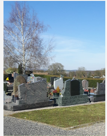
Le règlement du cimetière est affiché sur le site.

* Loi Labbé, arrêté du 15 janvier 2021 qui interdit l'usage de produits phytosanitaires de synthèse sur les cimetières à partir de juillet 2022.